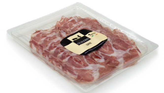
Coppa Di Parma