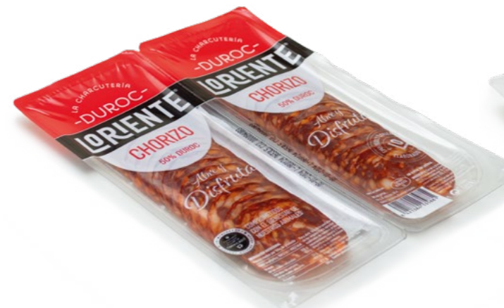
Chorizo Duroc 2*50 g 8421384135881