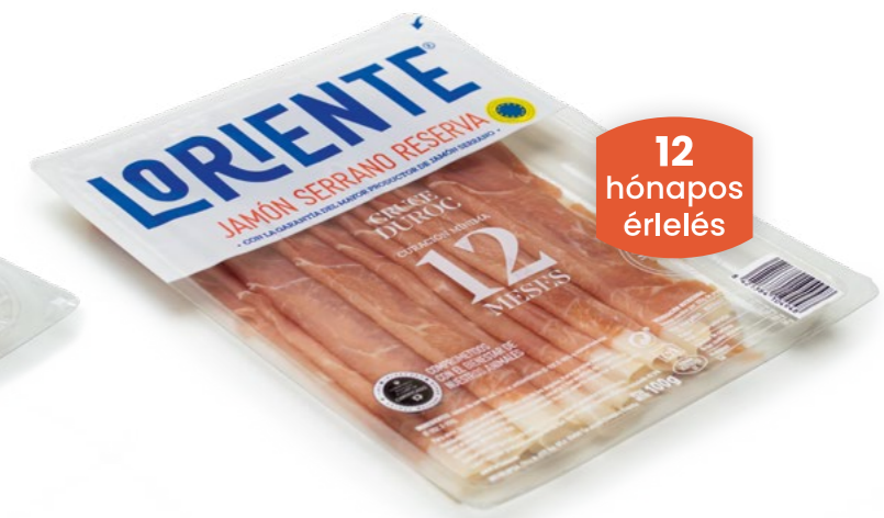
Serrano Duroc sonka 100 g 8421384104948