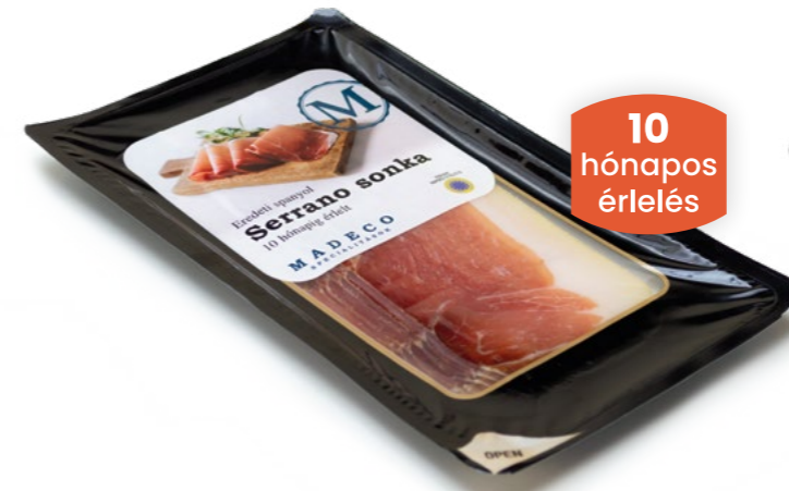
Serrano sonka 80 g 5999886198121

A spanyol konyha elengedhetetlen részei a chorizo és a serrano sonka, két ikonikus spanyol húskészítmény. Mindkét termék gazdag ízvilággal rendelkezik és sokoldalúan felhasználható a spanyol konyhában. A chorizót gyakran használják paellákban, tapasokban vagy szendvicsekben, míg a serrano sonkát szívesen társítják sajtokhoz, péksüteményekhez vagy önállóan előételként. A spanyol húskészítmények világszerte nagy népszerűségnek örvendenek egyedi ízviláguk miatt.