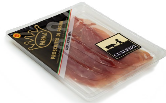
Prosciutto Di Parma