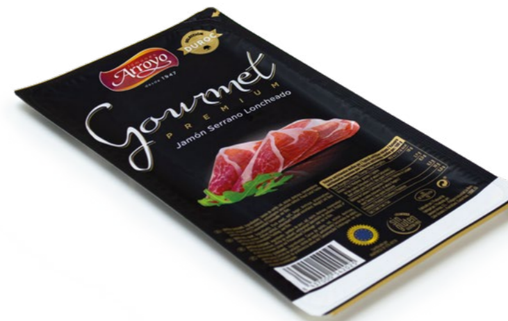
Serrano Gourmet sonka 50 g 8437000542025