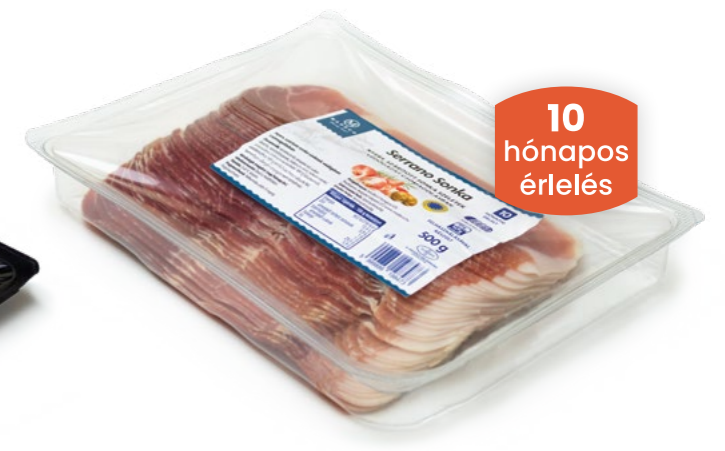
Serrano sonka 500 g 5999886198473