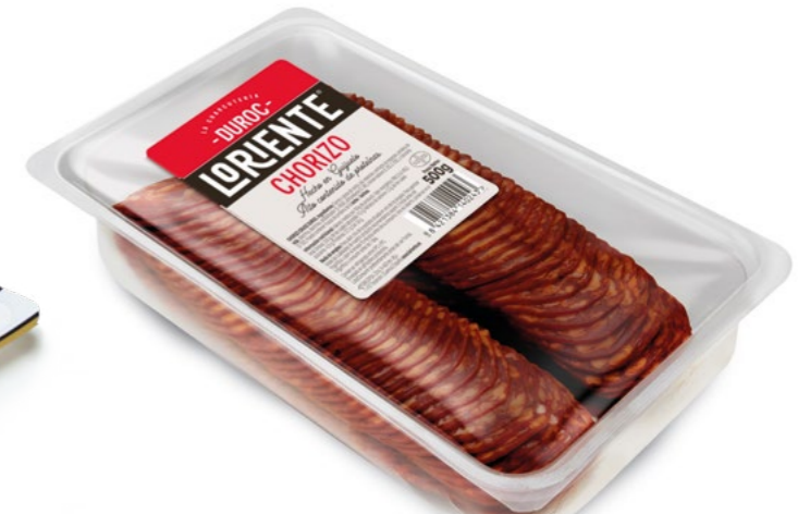
Chorizo Duroc 500 g 8421384140243